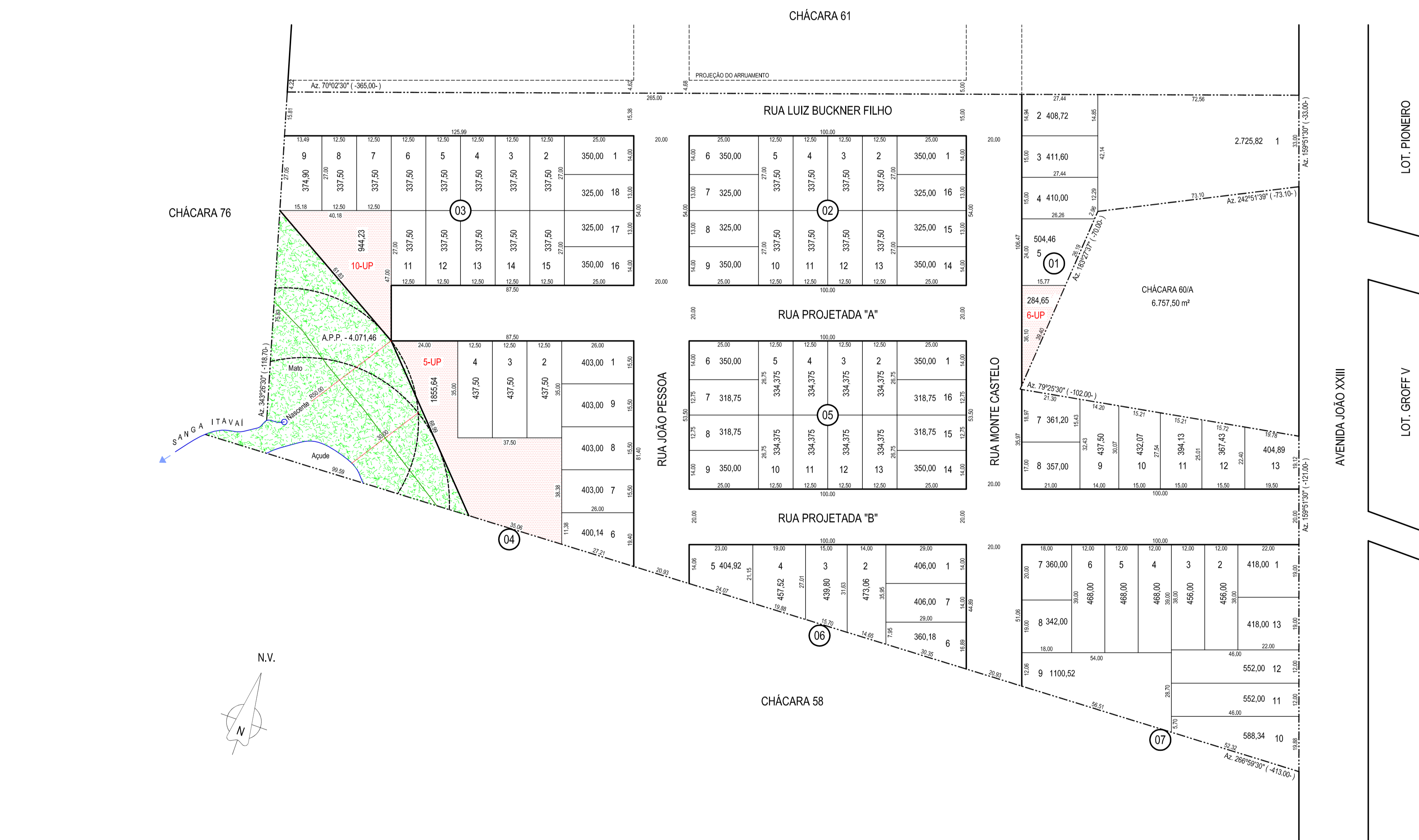
planta do loteamento