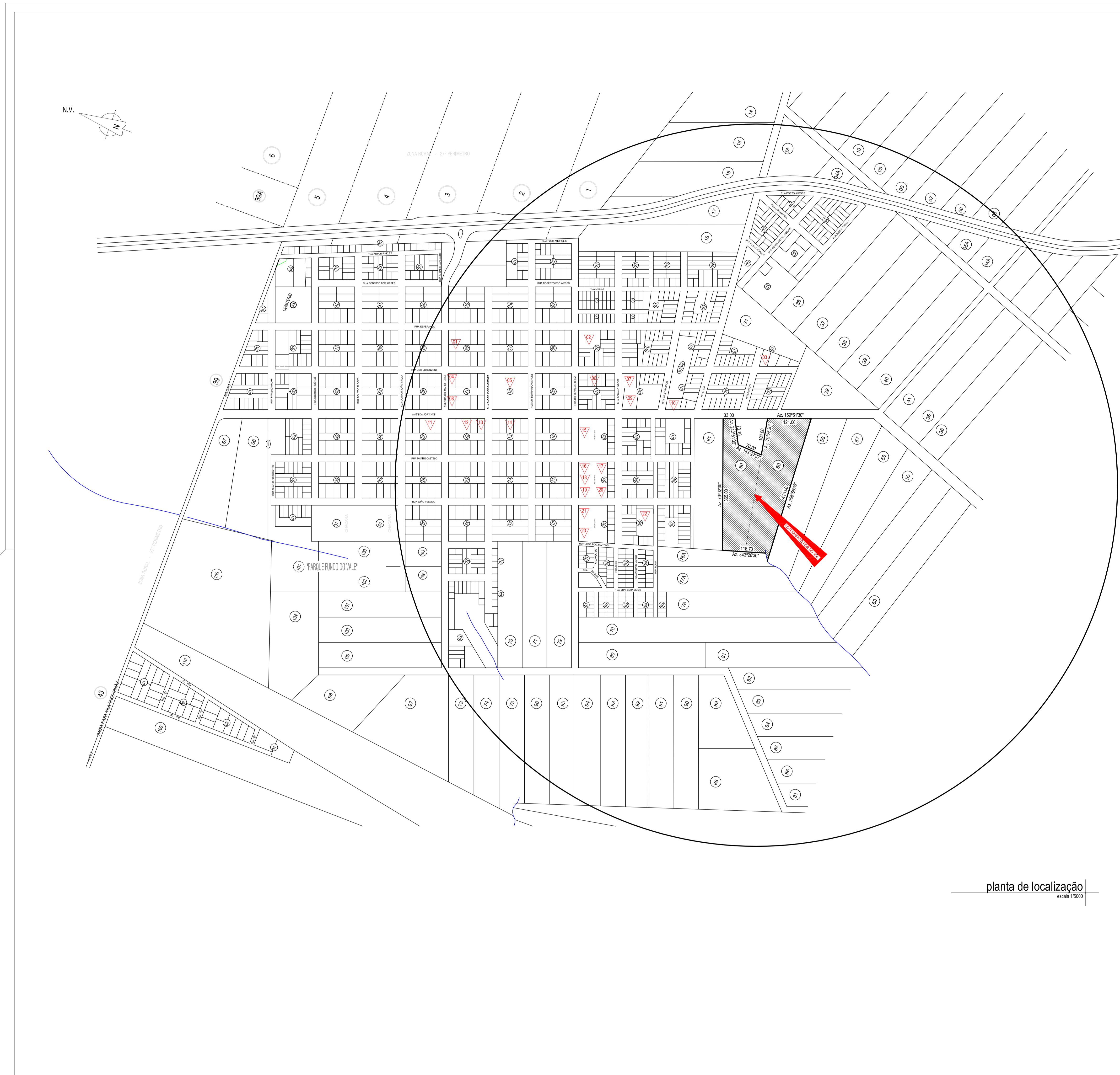
planta de localização